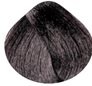
каштан пепельно- коричневый