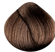
светлый блондин интенсивный