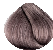
светлый блондин пепельно-фиолетовый