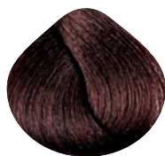
светло- коричневый махагон