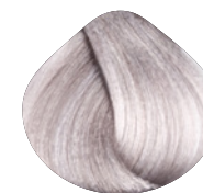
очень-очень светлый блондин натурально фиолетовый