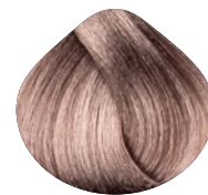
очень светлый пепельный блондин