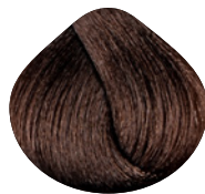
темный золотистый блондин