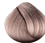
очень-очень светлый блондин пепельно-фиолетовый