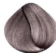
светлый блондин натурально фиолетовый