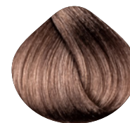
очень светлый блондин золотисто-фиолетовый