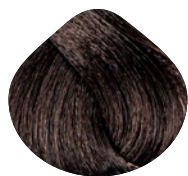
темный блондин интенсивный