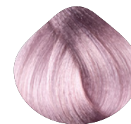
очень светлый блондин интенсивно фиолетовый