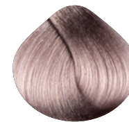
очень-очень светлый блондин фиолетово- махагоновый