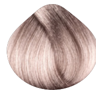
очень-очень светлый пепельный блондин