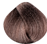
светлый пепельный блондин