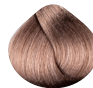
очень светлый блондин махагоново- пепельный