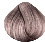
очень-очень светлый интенсивно пепельный блондин