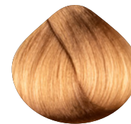
очень светлый золотистый блондин