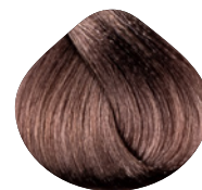
светлый блондин золотисто-фиолетовый