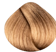
очень светлый блондин