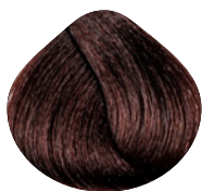
темный махагоновый блондин