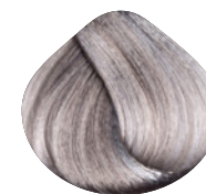
очень светлый блондин натурально-фиолетовый