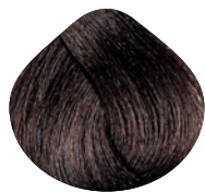
темный пепельный блондин