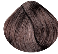
темный блондин пепельно- коричневый