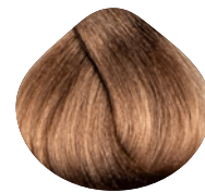
очень светлый интенсивный блондин