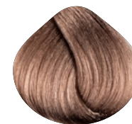
очень-очень светлый блондин золотисто-фиолетовый