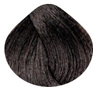
темный коричневый пепельный