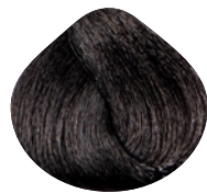
светлый каштан интенсивный