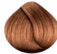
светлый золотистый блондин