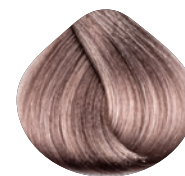
очень светлый блондин пепельно-фиолетовый